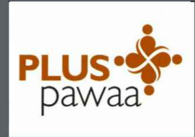
TDB sanctioned a loan assistance of Rs. 250.00 lakh out of the total project cost of Rs. 686.07 lakh under the agreement signed on 23 rd August 2012. The project was completed on 31 st December 2014.