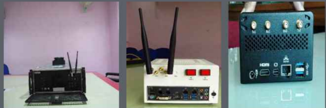
टीडीबी ने 2 जुलाई, 2012 को हस्ताक्षरित करार के अंतर्गत 585.33 लाख रु की कुल परियोजना लागत में से 240.00 लाख रु की ऋण सहायता मंजूर किया। परियोजना 30 सितम्बर, 2014 को पूरी हो चुकी है।

कंपनी ने व्यापक उत्पाद पोर्टफोलियो के साथ कदम रखा है जिसमें नवोन्मेषक उत्पाद (वायरलेस मिनिफर, एयर-टू-ग्राउंड, एल टी ई - लाइक इंटरफेस) जो अत्याधुनिक है शामिल है और अपने राजस्वों को महत्वपूर्ण रूप से बढ़ाने की संभावना रखती है। इसने वैश्विक और घरेलू आई पी आर लाइसेंसिंग के लिए 3 जी पी पी एल टी ई रिलीज - 9 मानकों के आधार पर स्वदेशी रूप से उत्पादों का और बाजार के विभिन्न घटकों यथा (1) बेस स्टेशनों मैक्रो, माइक्रो, पीको (2) हेण्डसेट्स, आई पी फोनस, ए एस आई सी और चिप तथा (3) इम्युलेटर्स; एम डब्ल्यू 2000 यू ई और एम डब्ल्यू 2000 ई बी एस तक पहुंच बनाने में स्पष्ट टी टो एम (टाइम - टू - मार्केट) लाभ के साथ रायल्टी के साथ उत्पादों का निर्माण किया।