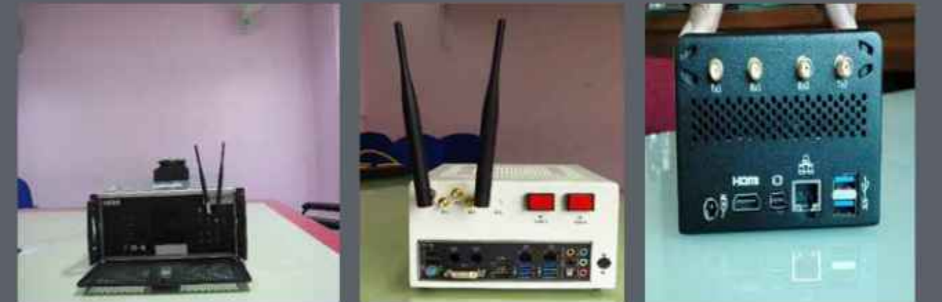
TDB sanctioned a loan assistance of Rs. 240.00 lakh out of the total project cost of Rs. 585.33 lakh under the agreement signed on 2 nd July 2012. The project was completed on 30 th September 2014.

The company has come up with a wide product portfolio, which includes innovative products (wireless sniffer, air-to-ground LTE-like interface) are cutting edge, and have the potential to significantly improve its revenues. It has built the products indigenously based on 3GPP LTE Release-9 standards for global & domestic IPR licensing and building the products with royalties with a clear TTM (time-to-market) advantage in reaching out to different segments of the market as: i) Base Stations: Macro, Micro, Pico, ii) Handsets: IP Cores, ASIC & Chip and iii) Emulators: MW 2000U UE and MW 2000E BS.