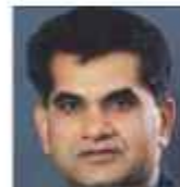
श्री अमिताभ कान्त