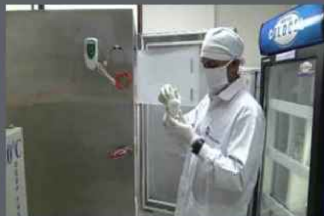
टीडीबी ने 23 अप्रैल, 2012 को हस्ताक्षरित करार के अंतर्गत 1200.00 लाख ₹ की कुल परियोजना लागत में से 600.00 लाख ₹ की ऋण सहायता मंजूर किया। परियोजना 31 दिसम्बर, 2014 को पूरी हो चुकी है।