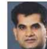
Shri Amitabh Kant