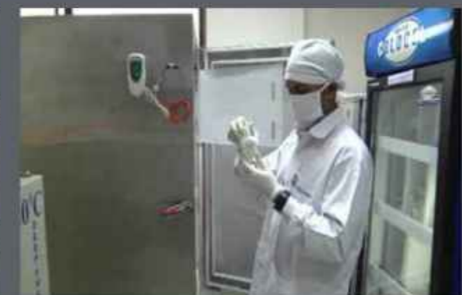
TDB sanctioned a loan assistance of Rs. 600.00 lakh out of the total project cost of Rs. 1200.00 lakh under the agreement signed on 23 rd April, 2012. The project was completed on 31 st December, 2014.